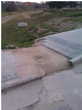
C/ ESCUELAS VIEJAS

3.- Queremos llamar la atención sobre el deterioro de las aceras, lo cual supone una dejadez hacia los vecinos de este municipio, para lo cual se adjuntan algunas fotos significativas: