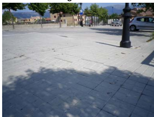
C/ Los Maestros – C/ Escuelas Viejas PALAZUELOS