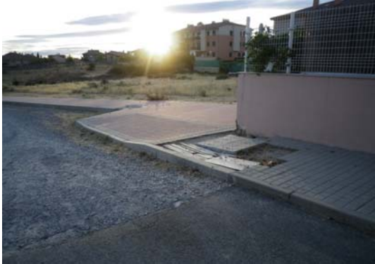
C/ Los Maestros – C/ La Solana PALAZUELOS

A.- Se acepta el ruego y se darán instrucciones para su cumplimiento, aunque la actuación de la Calle Solana casi seguro está incluida en la obra que tenemos contratada dentro de la línea ayudas de la Diputación Provincial.