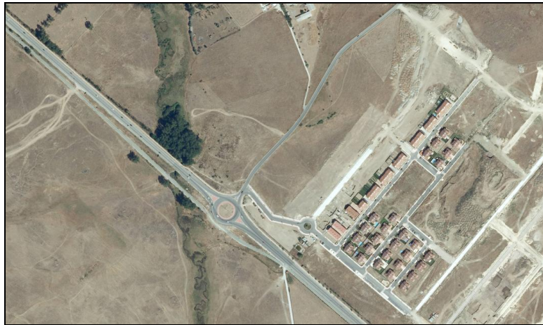
Fig.1.- Ortofotografía y situación de la urbanización con su actual entrada junto a la rotonda de la CL-601.

2.- Desde hace tiempo se está utilizando como entrada a la Urbanización COAP Carrascalejo II un vial que conecta con denominada “carreterina” o carretera de Palazuelos.