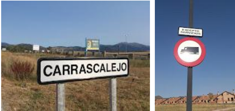
Fig.8.- Detalles de la señalización vertical localizada en esta entrada.

Se puede observar que la entrada está asfaltada, tiene aceras, alumbrado público, señalización vertical e incluso arbolado plantado en los alcorques.