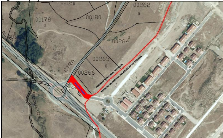
Fig.4.- Localización del acceso situado en el T.M. de Segovia y sobre suelo rústico