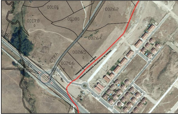
Fig.3.- Superposición de la ortofoto con la cartografía catastral