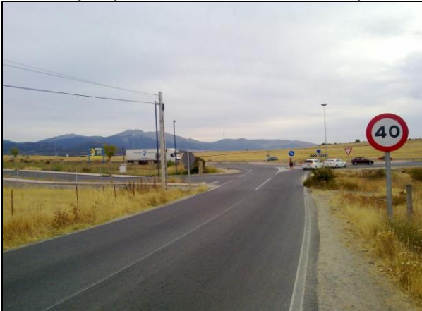
Fig.6.- Localización entrada "ilegal" junto a la rotonda de la CL-601

Que entendemos que esta entrada no cumple con las distancias mínimas de seguridad entre intersecciones, ya que dista menos de 10 metros de la rotonda, y el tráfico que por la misma transcurre puede suponer un riesgo cierto de accidentes.