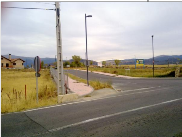
Fig.7.- Fotografía de la entrada

Que esta entrada dista mucho de ser provisional, pues contiene asfaltado, acerado, alumbrado público, arbolado e incluso se ha colocado una señalización anunciando la urbanización a la que sirve de entrada. Se adjuntan varias fotos.